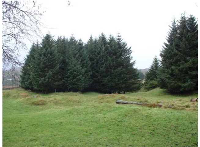
Figur 4: Planta sitkagran

Den første fasen av den organiserte skogreisinga var prega av overtydning om at sitkagran var overlegen alle andre treslag. Dette var i og for seg rett, men berre på høg og til dels på middels bonitet. Planting av sitkagran på delar av middels- og låg bonitet har gjeve dårleg resultat. Etter kvart som ein har fått erfaring er andre treslag vald i staden for sitkagran. Særleg kystfuru, contortafuru og bergfuru har gjeve gode resultat. Ein har og prøvd lerk, men tilslaget har ikkje alltid vore tilfredsstillande. Lauvtre har diverre fått hard medfart av hjortebeiting og elles er det vanskeleg å skaffe tilfredsstillande plantemateriale av lauvskog frå planteskulane.