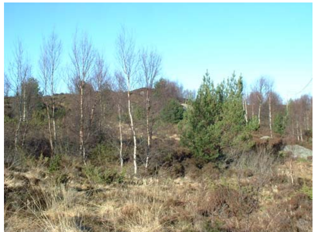
Figur 5: Attgroing av lynghei

Det finst store utmarksareal som ligg brakk og difor vert klassifisert som skogsmark. Mykje av den produktive snaumarka i hogstklasse 1 er i attgroing der store areal etter kvart blir dominert av utvoksen, gammal og glissen røsslyng. Etter få år med attgroing vil plantesamfunnet endre karakter frå å være vekstkraftig lynghei dominert av tett og vital røsslyng skjøtta av husdyrbeite til gradvis å verte infiltrert av andre arter i ein dynamisk livsprosess. Det menneskeskapte naturbiletet dominert av lynghei hadde maksimal utbreiing i førre århundre og er i ferd med å bli endra i raskt tempo.