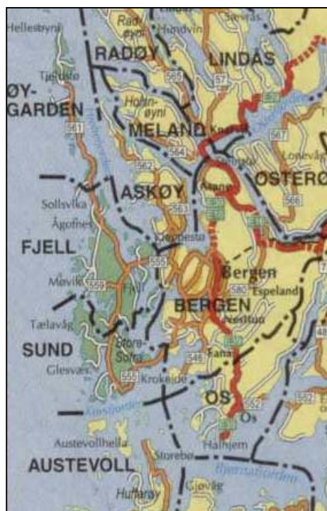
Figur 1: Kommunane våre ligg rett vest for Bergen.

Vanleg struktur for landbrukseigedommane er forholdsvis små innmarksareal og noko større utmarksområder. Dette er gjennomgåande likt for alle dei tre kommunane. Framtidig bruk av utmarka ha særleg mykje å seie for kulturlandskapet i regionen.