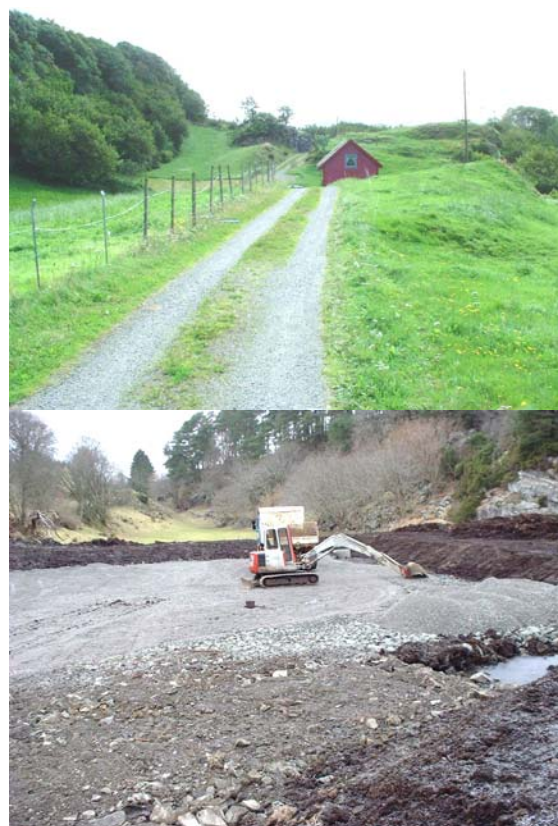
Figur 3 : Øverst; slåttemark på Nordvik. Nederst; Jordbruksareal godkjent omdisponert på Nese.

På tross av at det ligg ledige areal til slått og beite skjer det ein "import" av fôr til kommunane våre. Importen av fôr kjem i tillegg til at mange av sauene i regionen vert sendt på fjellbeite.